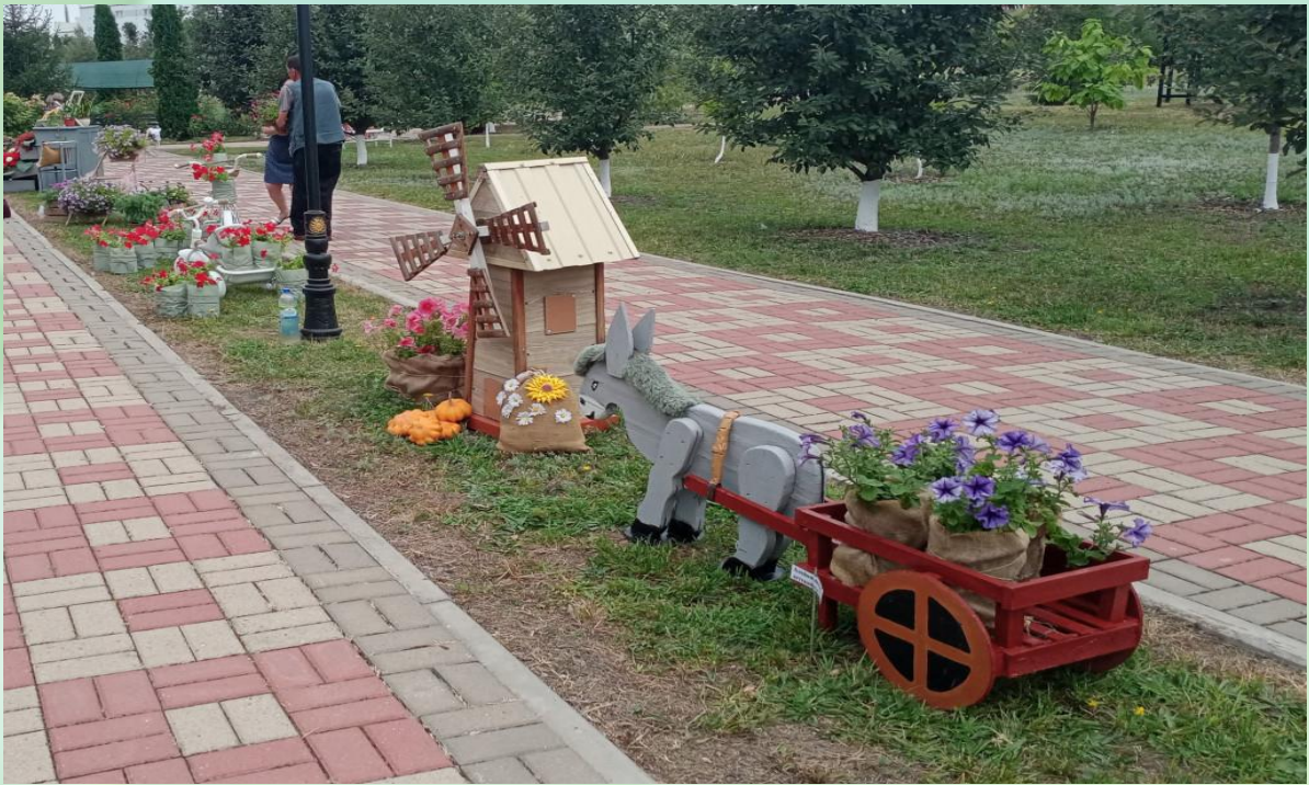
Приложение № 7